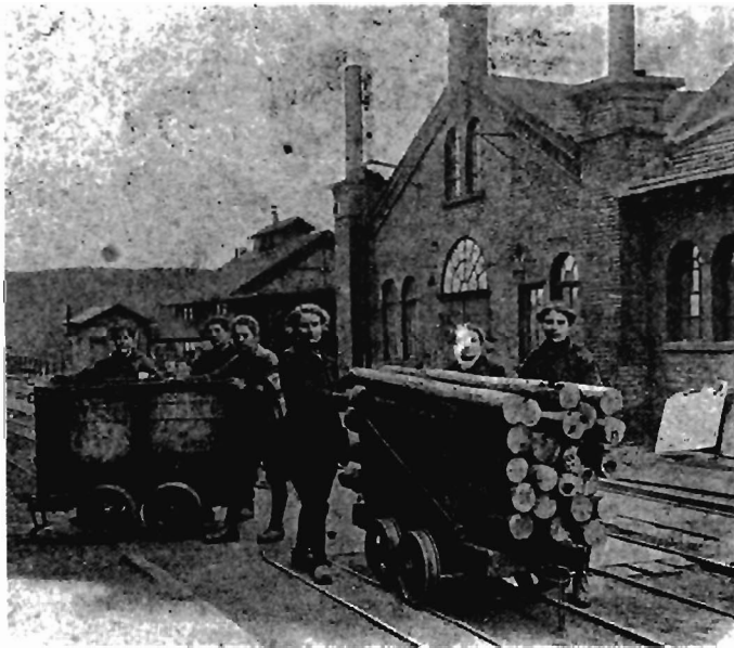
Das gleiche gilt auch für die Frauen beim Holztransport.

Ab März 1918 nahm die Zahl der beschäftigten Frauen auf allen Gruben ab. Auf der Grube Camphausen war die letzte Arbeiterin im Januar 1919 entlassen worden. 41 Dagegen arbeiteten im September 1919 noch sechs Frauen auf der Grube Dudweiler und eine Frau auf der Grube Jägersfreude. 42 Wann diese Frauen entlassen wurden, ist nicht aus der angegebenen Akte zu ersehen, denn diese endete mit dem September 1919.