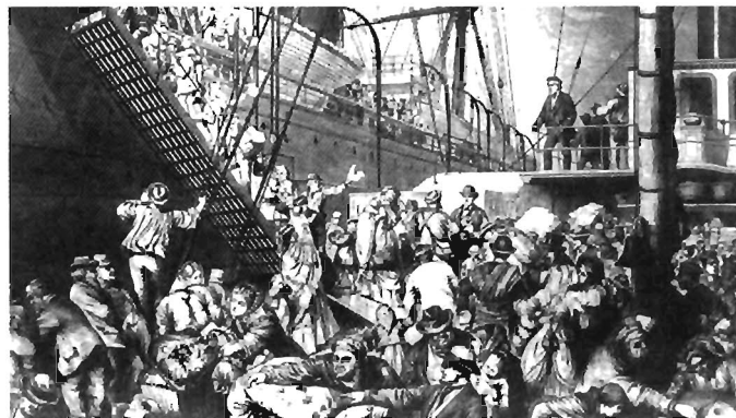
Auswanderer besteigen 1854 ein Schiff im Hamburger Hafen.

ergeben, daß im Verlauf des 19. Jahrhunderts viele Personen aus Dudweiler ausgewandert sind. Bisher konnten davon über 500 namentlich erfaßt werden. Da die Mehrzahl der Angaben aus den evang. Kirchenbüchern stammen (75 %) und von Auswanderern mit kath. Konfession keine derartigen Niederschriften vorhanden sind, dürfte die Gesamtzahl der Ausgewanderten entschieden höher liegen.